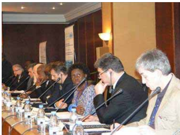
Рис. 3. Пленарная сессия Генеральной ассамблеи МСБО

Деятельность СВО ВЕКЦА была презентована на международном форуме «Капля воды – крупца золота» (Ашхабад, Туркменистан, 2-4 апреля 2010 г.), в котором приняли участие представители России,