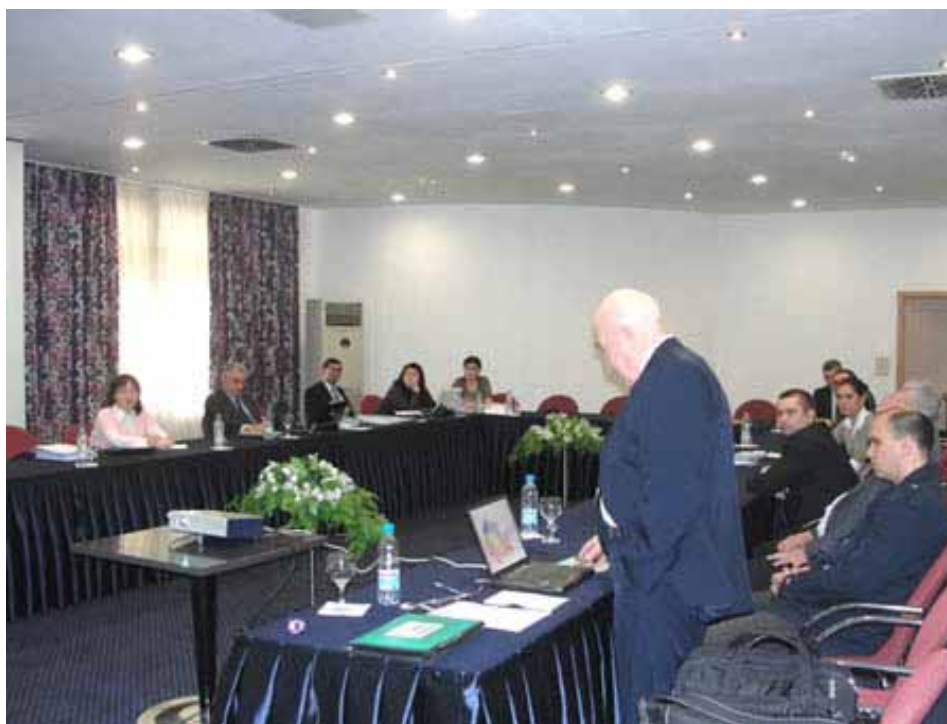
Рис. 4. Рабочая встреча с участием представителей Узбекистана, России и стран Южного Кавказа

В семинаре приняли участие 50 человек - представителей научных, проектных, производственных и информационных организаций из России, Украины, Беларуси, Молдовы, Узбекистана, Казахстана, Кыргызстана, Таджикистана, Азербайджана.