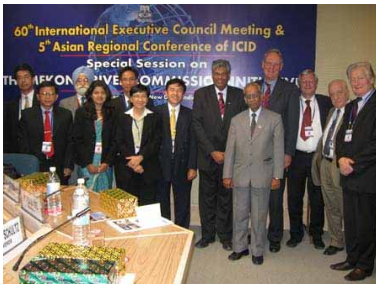
Рис. 2. Специальная сессия по бассейну Аральского моря «Вода и продуктовая безопасность в Центральной Азии» на 5 Азиатской конференции МКИД

русскоговорящей сети стран Восточной Европы, Кавказа и Центральной Азии (рис. 3).